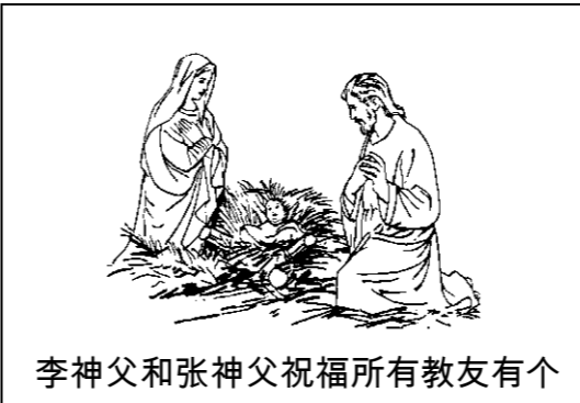
李神父和张神父祝福所有教友有个